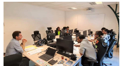
Formation pour les îles sept 2023