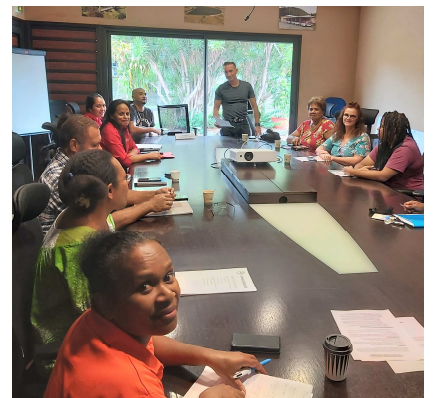
Formation à La Foa février 2023