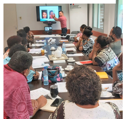
Formation à Koné avril 2023

Responsabilité, vigilance et bonnes pratiques !